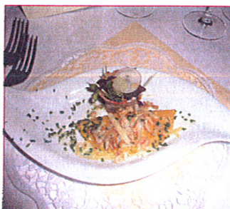
Der Gruß aus der Küche

Kaiserhofschüler und -lehrpersonen Geld für guten Zweck sammeln. Immer wieder werden Gala-Abende bzw. Wohltätigkeitsveranstaltungen von Lehrern und Schülern organisiert oder mitgetragen. Dies soll auch die Sozialkompetenz der Schülerinnen und Schüler stärken.